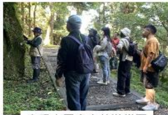
東眼山國家森林遊樂區