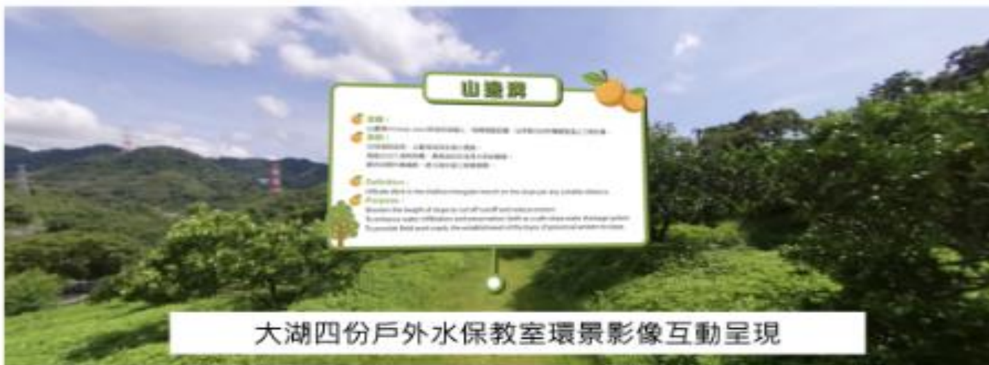
大湖四份戶外水保教室環景影像互動呈現