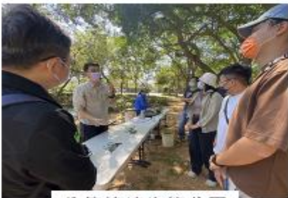
八德埤塘生態公園