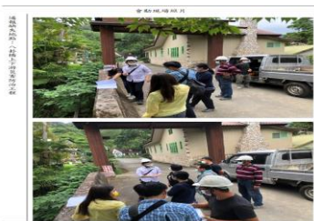
現場會勘協調照片