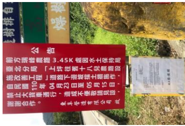
改分水土保持局台北分局 —「上坪往舊十八兒農路 設施改善工程」