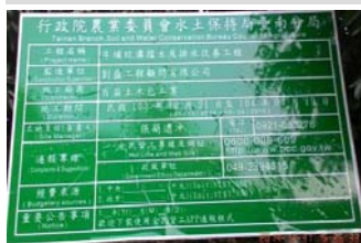
牛埔坑溝擋土及排水改善工程告示牌